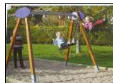
J452-Hinta (2,40m) Kétüléses hinta 3-10 éves korosztály Útészillapítás: Gyöngykvacs feltöltés