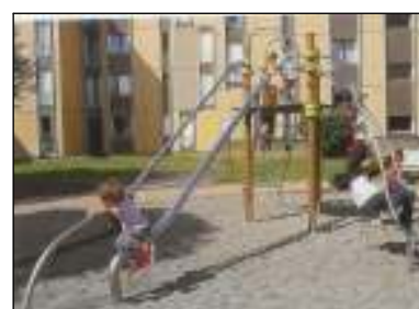
J2521-IXO Mászóka 8-14 éves korosztály Útészillapítás: Folyami mosott homok 4/16