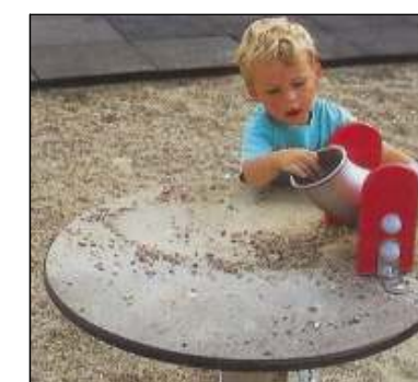
J122-Homokozó Billenőcsöves sütőasztallal Homokozó 1-8 éves korosztály Feltöltés: Bányahomok 0/4