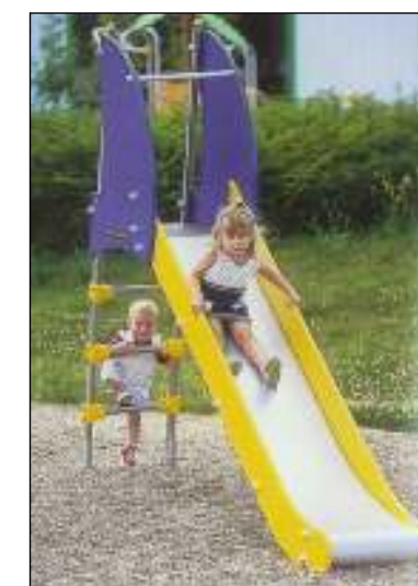
J1054-Kis csúszda Csúszda 2-6 éves korosztály Útészillapítás: Gyöngykvacs feltöltés