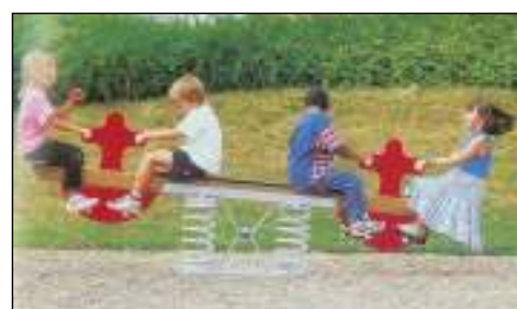
J983-Szivattyú Mérleghinta 2-12 éves korosztály Útészillapítás: Gyöngykvacs feltöltés