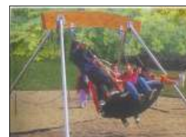
J440-Fézek hinta Hinta 2-8 éves korosztály Útészillapítás: Gyöngykvacs feltöltés