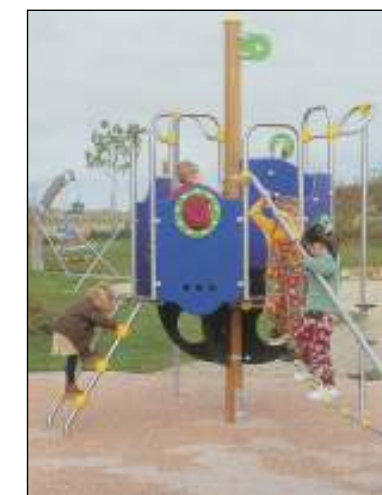
J2641-Aquatica Mászóka 3-8 éves korosztály Útészillapítás: Folyami mosott homok 4/16