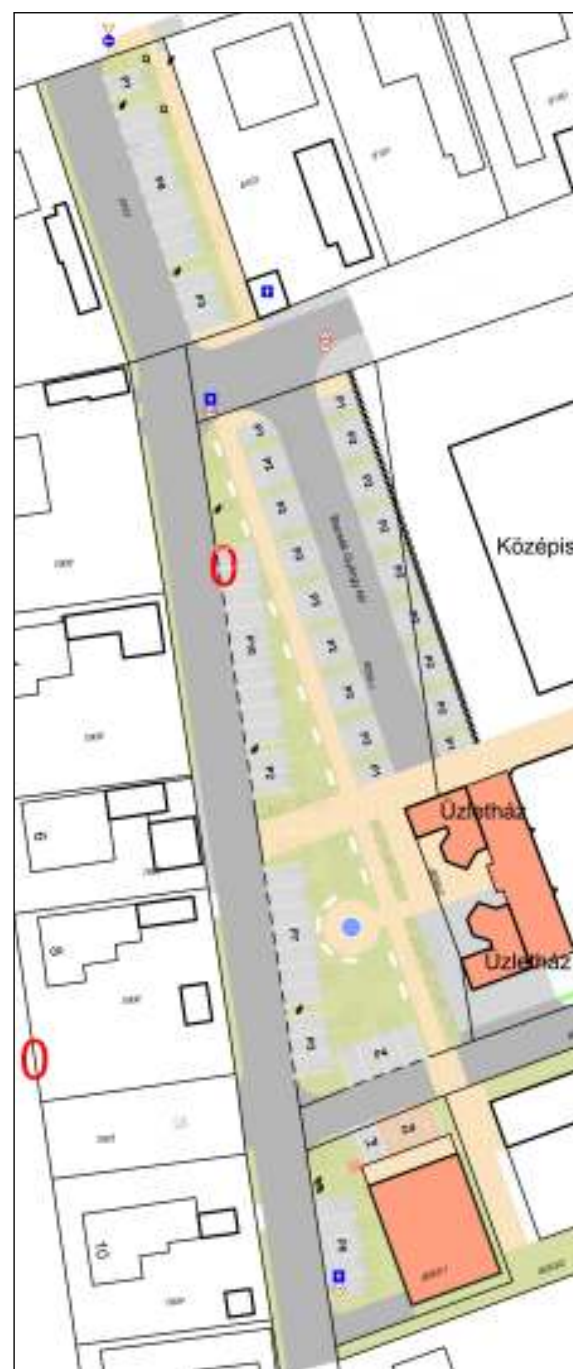
BACSAK TÉR KÖRNYEZETÉNEK TERVE