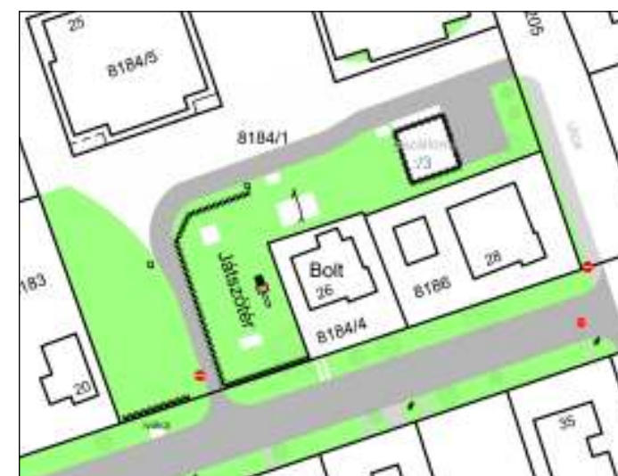
A 8184/1 HRSZ KÖRNYEZETÉNEK VIZSGÁLATA