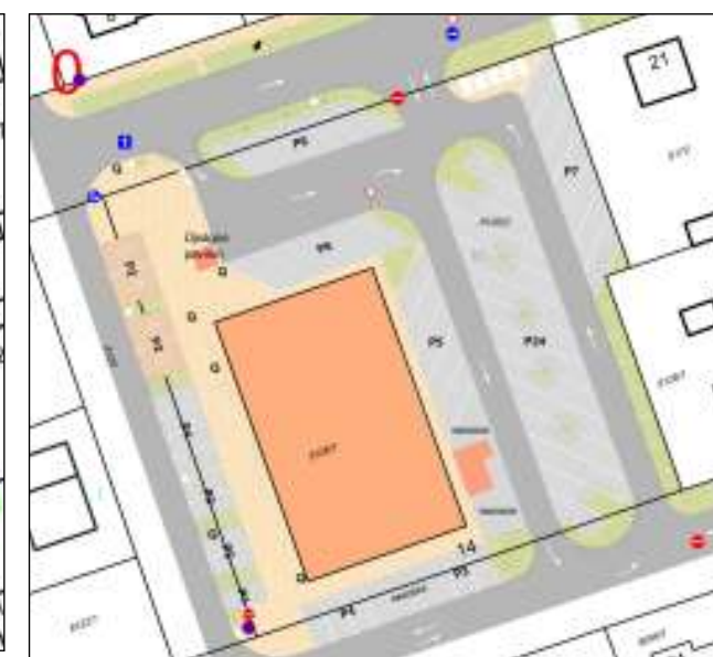
PÁTIA ÁRUHÁZ KÖRNYEZETÉNEK TERVE