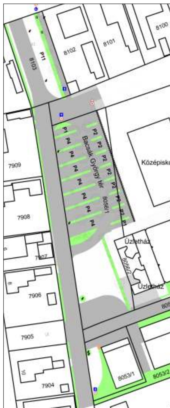
BACSAK TÉR KÖRNYEZETÉNEK VIZSGÁLATA

Pátia mögötti keleti oldalon a rendezetlen parkoló átépítése: átmenő útra szervezett, kétoldali, ferde beállású parkolók kialakításával. Az Áruház bejárati részeinek (árufeltöltő helyeinek) elkülönítése, burkolatból való kiemeléssel. Kialakításra kerül egy koncentráltan elhelyezett szelektív hulladékgyűjtő hely is. A közlekedési és parkoló felületeken kívüli részeket zöldfelületként alakítjuk ki. Kialakítunk 2 parkolót a mozgásukban korlátozottak részére.