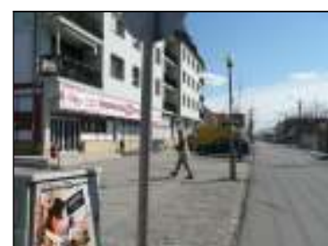
FOTÓK A NÉGY TERÜLETRŐL