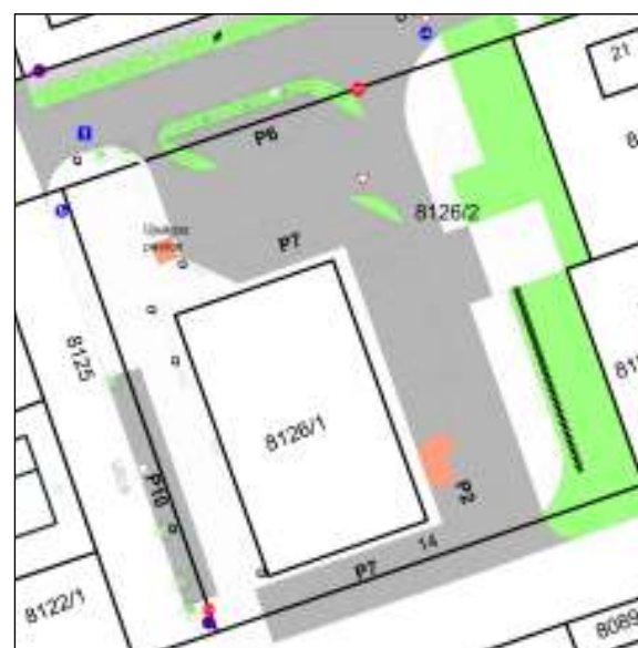
PÁTIA ÁRUHÁZ KÖRNYEZETÉNEK VIZSGÁLATA