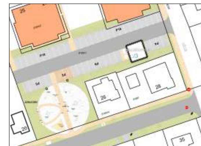
A 8184/1 HRSZ KÖRNYEZETÉNEK TERVE