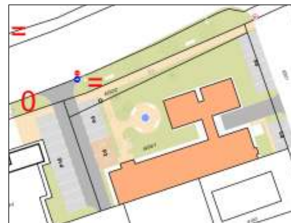
OKMÁNYIRODA KÖRNYEZETÉNEK TERVE